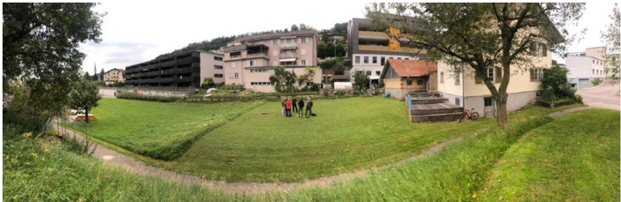
Foto Standort Weiermatte