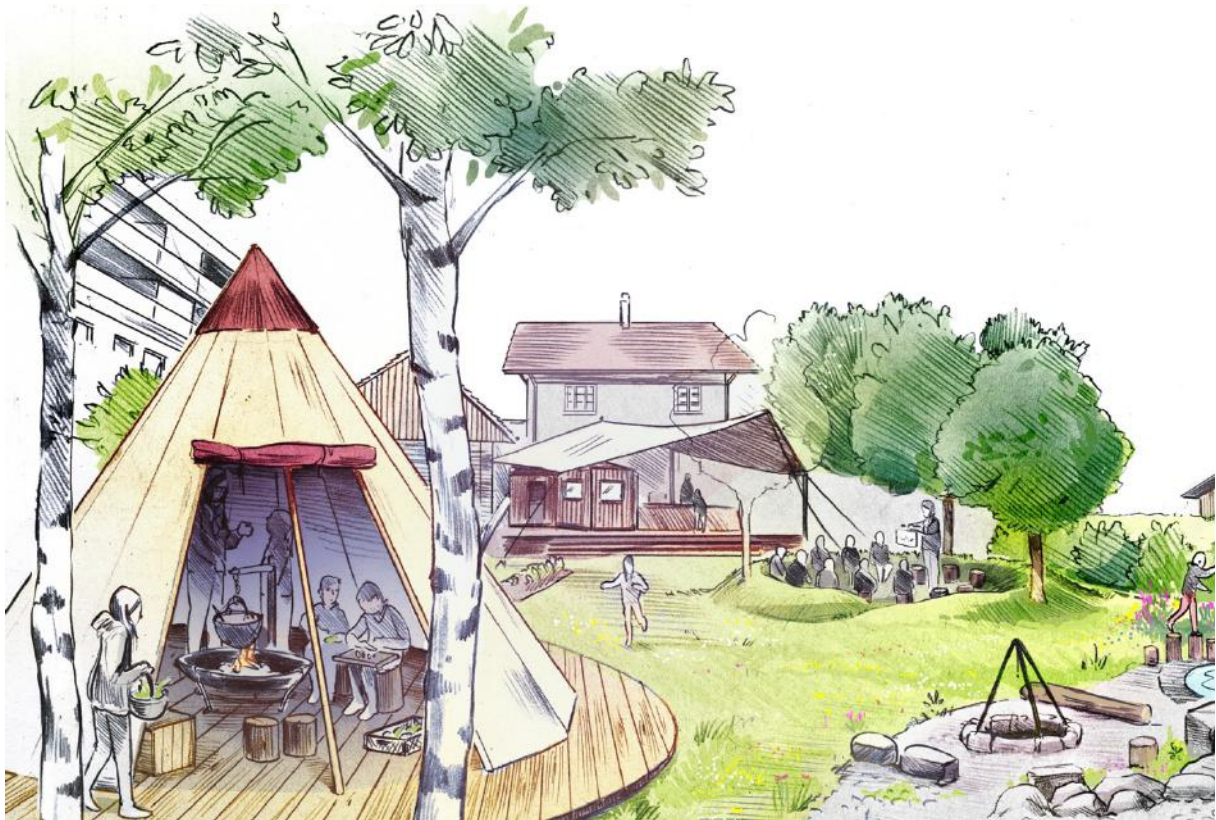
Illustration des geplanten Naturkindergartens Standort Weiermatt

Auf der Wiese Weiermatt stellt die Gemeinde dem geplanten Naturkindergarten das Gelände für ihre Homebase zur Verfügung. Hier verfügt der Naturkindergarten über einen angelegten Natur-Spiel- und Entdeckungsraum sowie eine schützende Infrastruktur. In der Nähe der Sandgrube soll den Kindern zudem ein gedecktes Waldsofa für den Waldunterricht bereitgestellt werden.