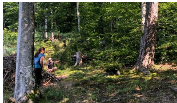
Waldsofa Standort östlich des Teiches